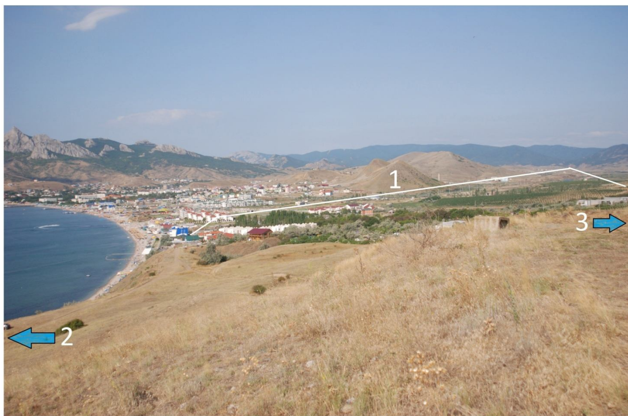
Рис. 2. Коктебельская долина и место расположения поселения Коктебель: 1 – долина; 2 – поселение; 3 – родник.

Таким образом, непонятным остается выбор древними жителями именно этого возвышенного участка для размещения поселения. Предположение о сезонной стоянке пастухов маловероятно, ибо насыщенность культурного слоя керамикой и другими находками достаточно плотная, без прослоек. Территория возле источника воды более удобна, защищена в балке от ветров. Устройство здесь кошары или небольшого поселения более приемлемо. Кроме того, удобная и закрытая от ветров, обводненная в древности обширная долина к западу от поселения никак не могла быть занята другими поселениями в такой мере, чтобы потребовалось разместить данное поселение на высоком, незащищенном берегу. Эти факты не вписываются в традиционное понимание стоянок, которые оставляли катакомбники в степной части Крыма у берегов небольших речушек, зато вписываются в понимание жизнедеятельности каменского населения [4, с. 98].