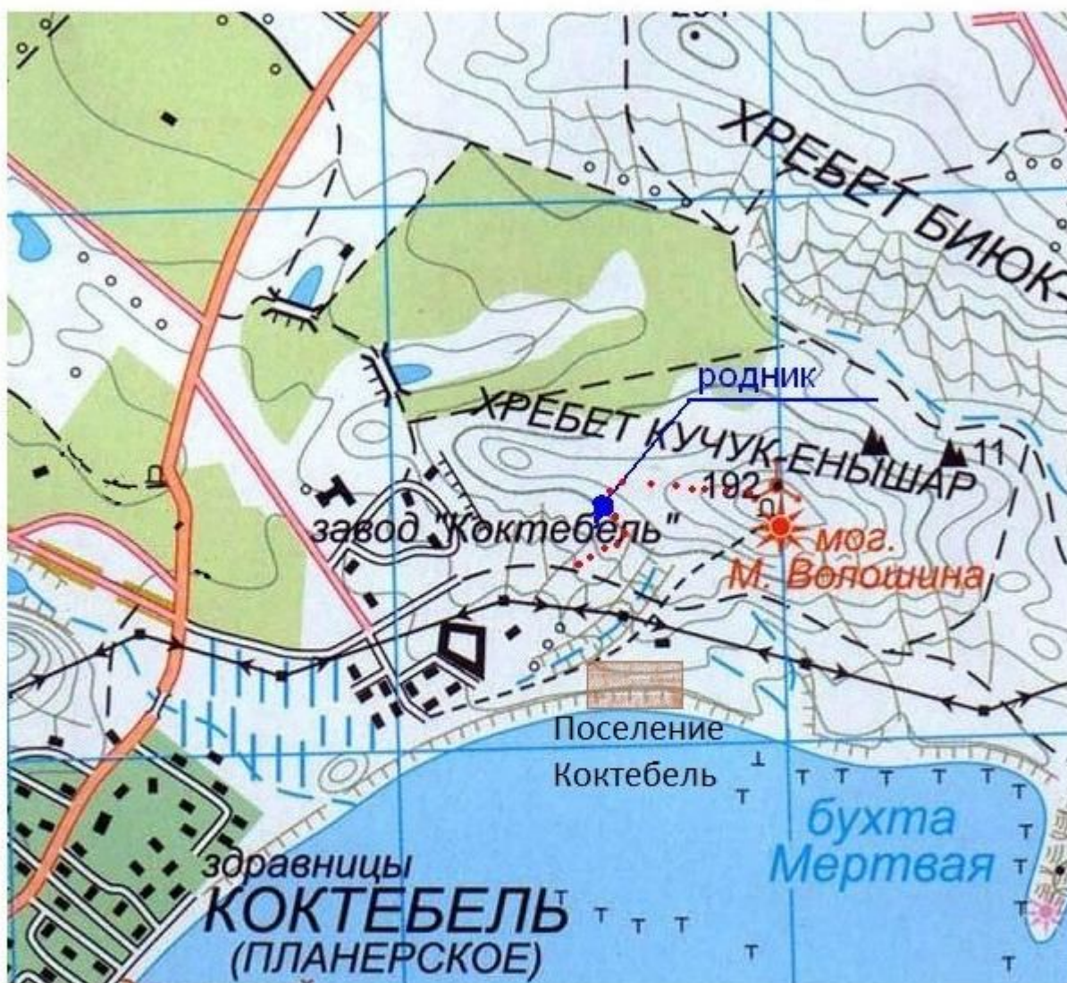
Рис. 1. Карта-схема расположения поселения Коктебель.

Ландшафт окрестностей достаточно разнообразный. Северо-восточный холм является доминирующей высотой конкретно у побережья, в месте расположения поселения, к северу идут более высокие холмы, с западной стороны имеется удобный плоский участок. Также с запада, со стороны Коктебеля, и с востока имеется ряд оврагов, перпендикулярных продольному сечению холма. К северу от поселения после небольшой долины начинается подъем на возвышенность Кучук-Енишлар (т. н. «гора Волошина»). С южной стороны возвышенности в овраге примерно в километре от поселения находится источник питьевой воды (рис.1; 2).